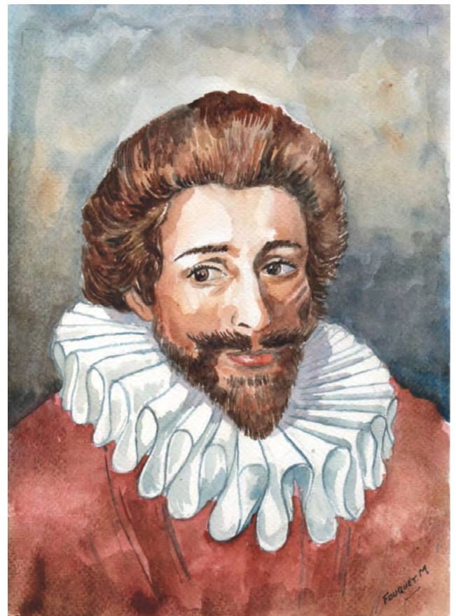
François de Lorraine, Duc de Guise dit le Balafré

Celui que nous appellerons désormais Henri IV dût momentanément renoncer à prendre Paris. Son chemin, pour être accepté par tous les Français fut long. Il fallut encore beaucoup de combats et en même temps une grande bienveillance politique, sans esprit de vengeance, pour y parvenir. Le 20 septembre, Henri IV battit le duc de Mayenne, frère du duc de Guise à Arques, près