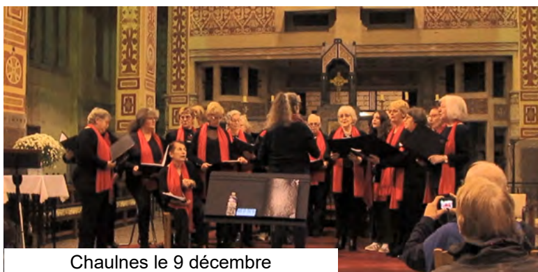
Chaulnes le 9 décembre

Un très beau spectacle où chaque chorale a pu présenter des chants très variés fort bien interprétés dans une église pleine de spectateurs... un très bon moment.