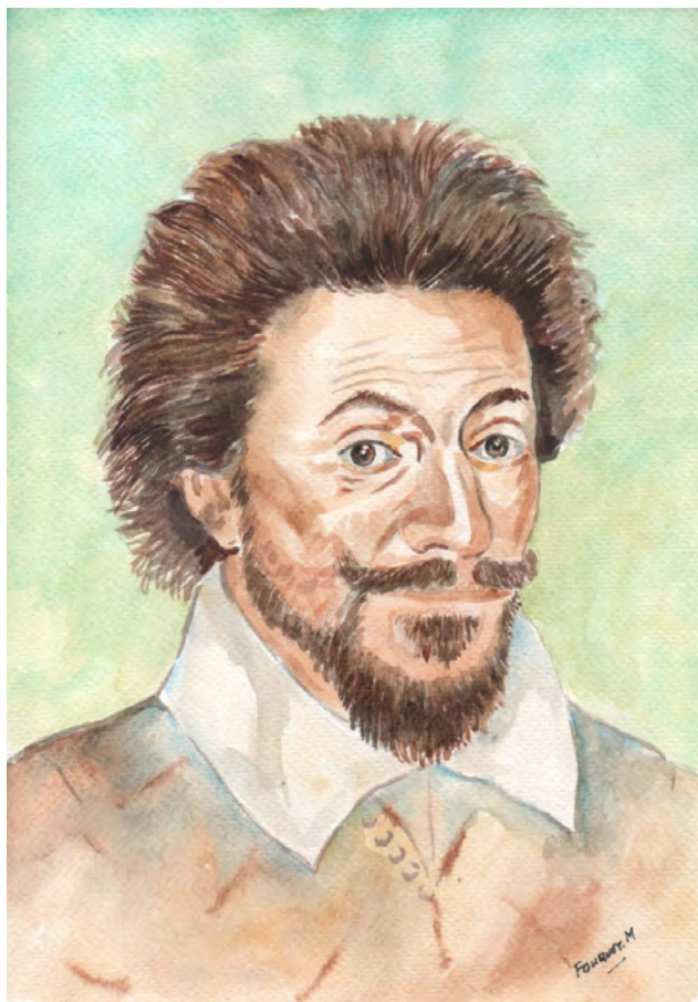
Jean De Montluc ou Montluc Seigneur de Balagny

Cambrai, bien que ne faisant pas partie des Pays-Bas, se rallia également au duc d'Anjou qui nomma Jean de Montluc, gouverneur de la ville. Après le décès du duc d'Anjou, Montluc