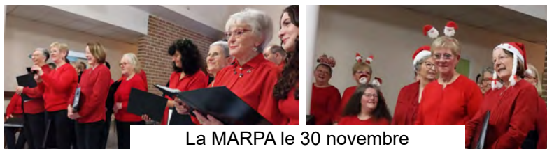
La MARPA le 30 novembre

Concert de Noël le 7 décembre à Pertain avec le groupe vocal Pourquoi Pas ! de Conty. Un grand moment de chant pour ces deux chorales qui ont la même cheffe de chœur. Les spectateurs, venus malgré la tempête, n'ont pas regretté leur déplacement : ce fut un très beau concert joyeux et varié dans une chaude ambiance.